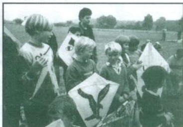
Hodní kluci to byli, že?